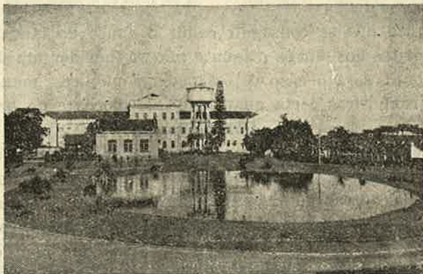
Fig. 2 — Aquário de um milhão e oitocentos mil litros, onde os peixes foram salvos pelo tratamento da água

Os peixes, em todos êles, logo se aquietaram. Pela manhã seguinte verificámos que as águas antes tão turbidas, de cor plúmbea, estavam perfeitamente claras, transparentes mesmo, deixando vêr os fundos. O cálcio combinado com os ácidos, formara eletrolitos que, dêsse alcalino-terroso, são tão eficientes nas precipitações dos colóides das pseudo soluções. As faixas de calíça apareciam nitidamente; a nata irisada das superfícies desaparecera e sobrenadantes percebiam-se as partículas de carvão com tendência a formarem pequenos aglomerados aquí e acolá.